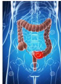
Рак толстой кишки