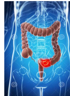
Рак толстой и прямой кишки